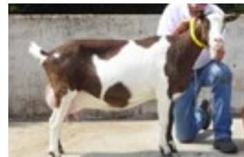
Een van de oudere geiten in de lijst (2014) is Zwaanheuvel Roxanne 3.

D rie geiten haalden meer dan 90 punten voor algemeen voorkomen. Er waren maar liefst 93 punten voor Driesprong Marieke 13.