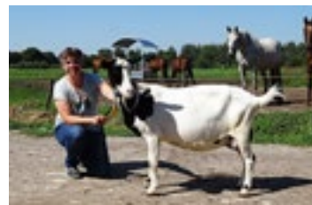
Driesprong Elda 15 komt uit dezelfde stal als de nummer 1 in de lijst.