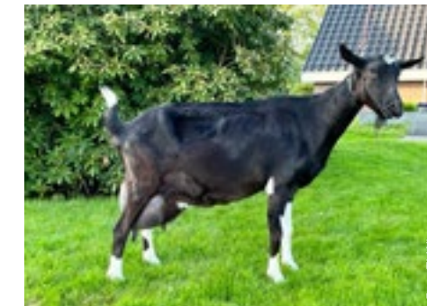
Met 7,88 kg melk per dag staat Maaïke 10 bovenaan de productielijst.

Esther 136 van Domsta komt uit Esther 116, een Wyldpeadster Boris uit Esther 105 van Domsta. Die laatstgenoemde is een dochter van Bert van de Geffesenberg en was de nationaal kampioen op de keuring in 2000. Esther 136 is er niet meer, wel is er nog een dochter van haar en Viktor P aanwezig.