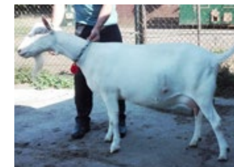
Een CVE van 116 zet Odilia 25 van Frans Dirven op plek 6 in de productielijst.