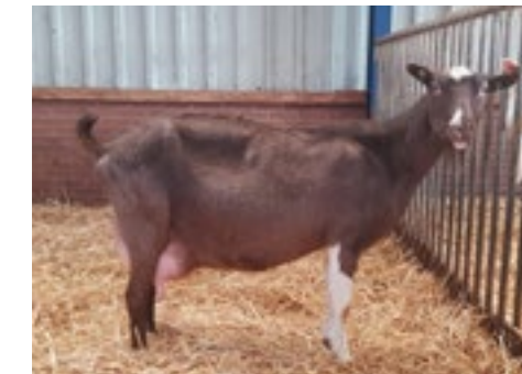
De Noortjes blijken goede producentes. Noortje 7 heeft een CVE van 146.