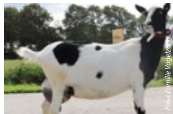
Een grote geit en goede moeder, deze Roos van de Ommelanden.